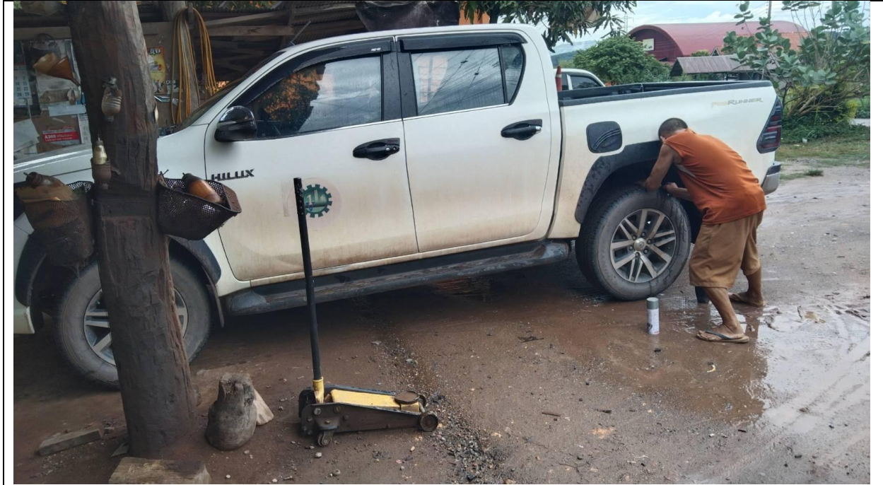
เอารถ8895ไปประยาง